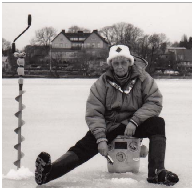
Stilstudie under RM i Pimpelfiske på Mälarens is utanför Sigtuna