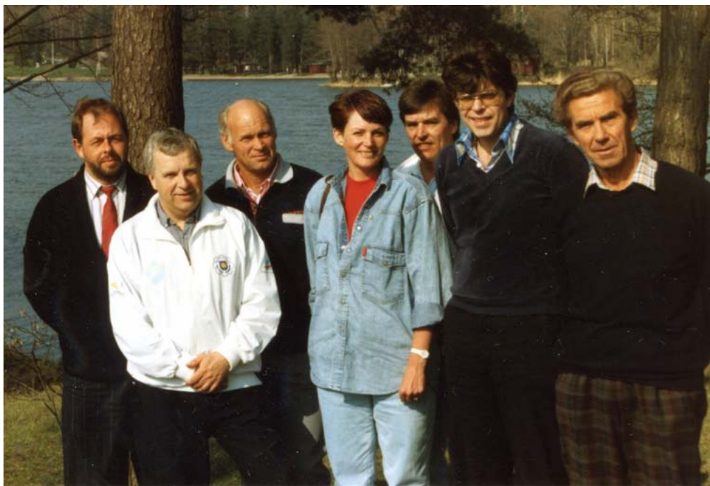
Gruppen som samlades i april 1989 för att planera K A F:s kommande verksamhet