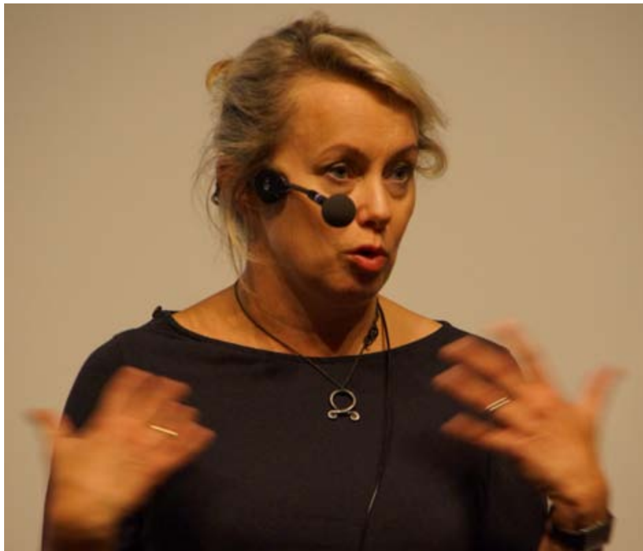
Louise Hoffsten på Årets konferens i Motala