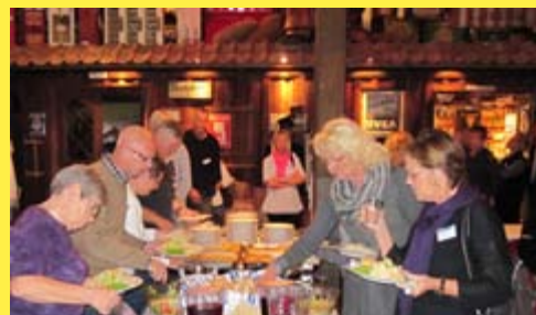
Årets konferens i Nyköping