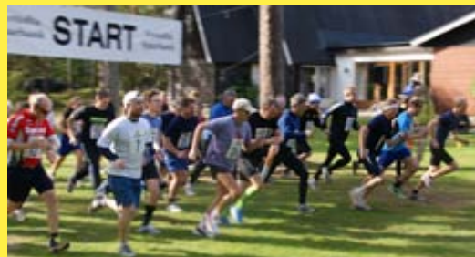
Riksmästerskap i terränglöpning i Kristianstad