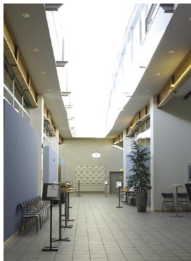
Pulsen konferens erbjuder spännande arkitektur i kvarteret Åstern.

Pulsen konferens • www.pulsenkonferens.se