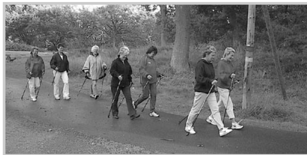
Stavgångsgruppen på historisk mark, på väg mot Stensö Udde