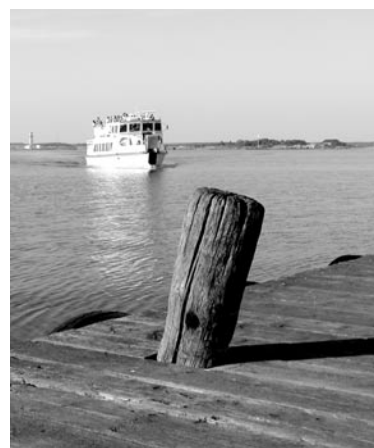
Karlskrona skärgård