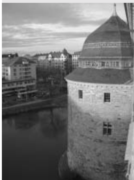
Omslagsfoto: Örebro Slott