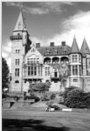
Teleborgs slott i Växjö.

KAF's kansli: Västra Boulevarden 13 291 80 Kristianstad tel 044 - 13 51 52 fax 044 - 12 84 49 www.kafinfo.nu